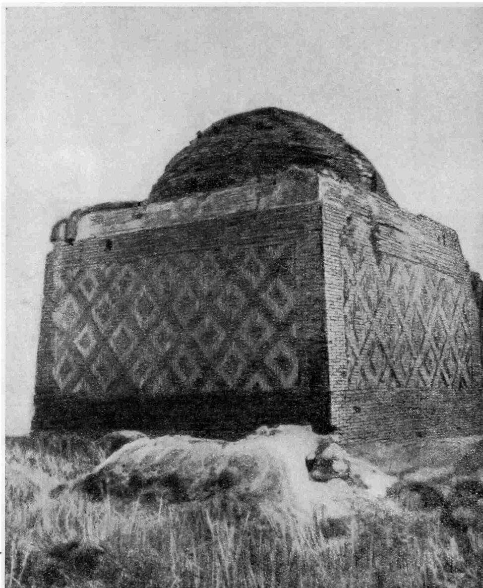
Рис. 36. Мавзолей Алаша-хана (XI—XII вв.). Вид с северо-востока

Мавзолей Алаша-хана по своей архитектурной форме и стилю имеет много сходных элементов с датированными памятниками XI—XII вв. Это позволяет решать вопрос о времени его возникновения, в частности, путем